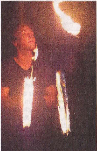
Die Sportjongleure ließen brennende Fackeln fliegen.

Stadensen. Schon nach knapp zwei Stunden mussten die ersten Getränke nachgeordert werden. Auf dem Weg dorthin strahlten die Gesich-