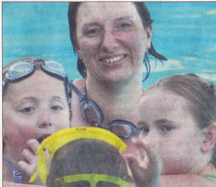
Auch Familien hatten beim Nachtschwimmen ihren Spaß.

Die hochgestellten Maishalmehorings um das Becken wirkten wie südländische Palmen und mit Einbruch der Dunkelheit warfen die Strahler eines Lichtmastes ihre Helle auf das Wasser, Lampions in den Bäumen, aufgestellte Kerzen, Windlichter, Fackeln und Feu-